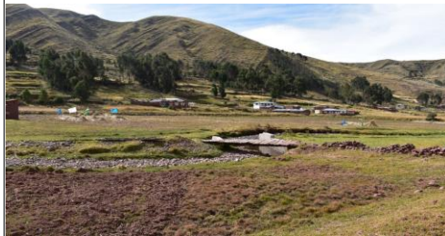
FOTO 03: Viviendas asentadas en los alrededores de la ribera del río